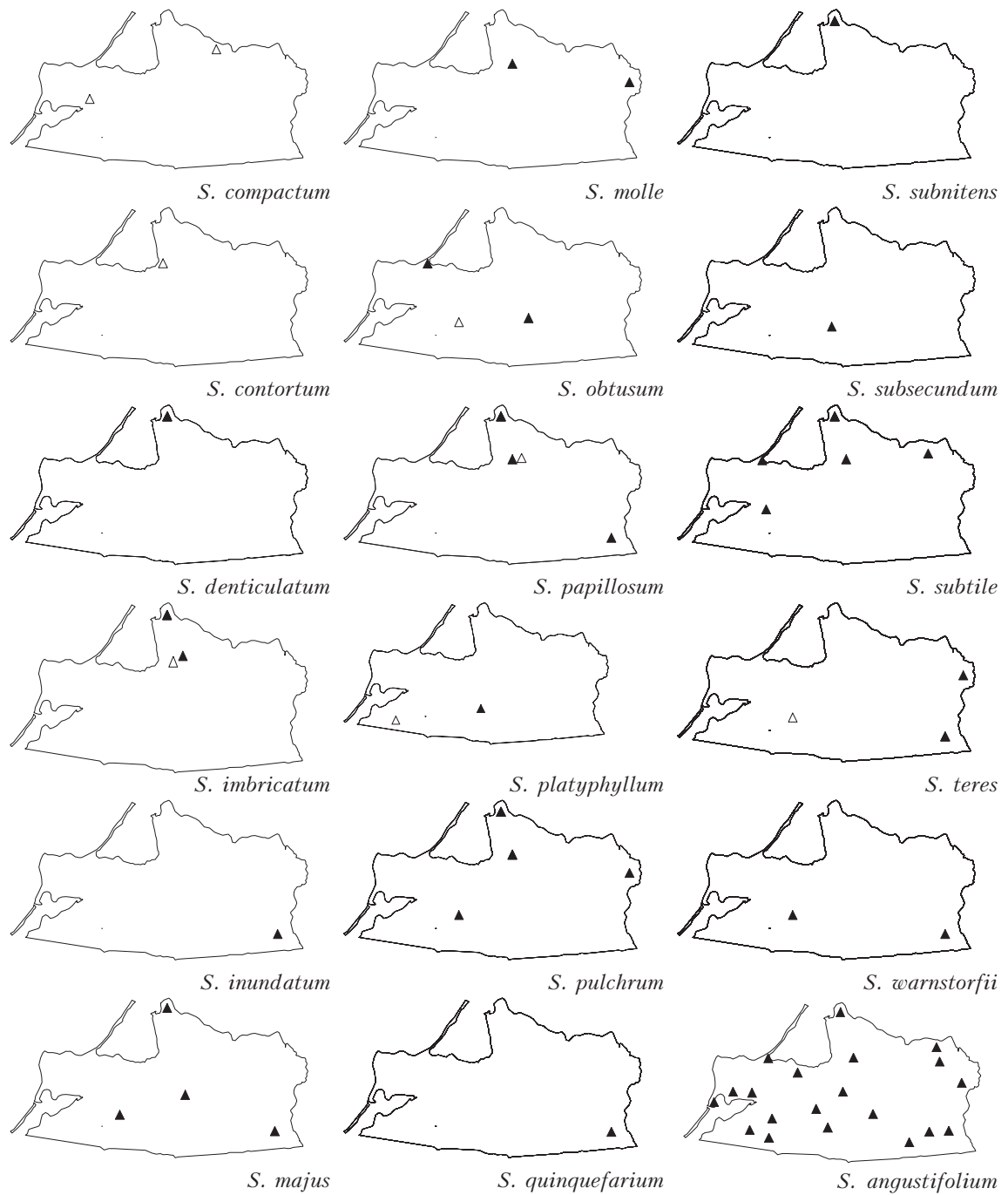
Fig. 2 Distribution in the Kaliningrad Province of rare species of Sphagnum and S. angustifolium , as an example of a relatively common species: “▲” – specimens seen; “△” – literature data of German botanists before 1940.

Рис. 2. Местонахождения на территории Калининградской области редких видов сфагнов и S. angustifolium , как пример более частого вида: “▲” – собственные сборы или данные гербария Калининградского университета и “△” – литературные данные немецких ботаников до 1940 г.