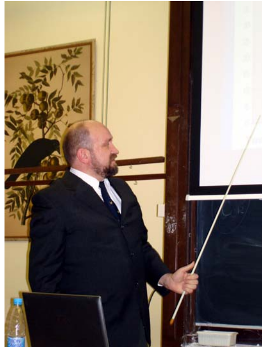
Доклад на защите докторской диссертации. Санкт-Петербург, 2007 г.

На международных арахнологических конгрессах и коллоквиумах Ю.М. завёл восхитительную