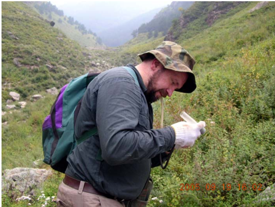
Экспедиция в Китай. 2005 г.

ки Хиппой, в Ленинграде в 1984 г., куда финны приезжали, чтобы поработать с коллекциями Зоологического института. Однако, реальное сотрудничество с финскими коллегами началось после 1989 г., после участия Ю.М. в международном арахнологическом конгрессе в Турку; как результат, появились первые совместные работы — фаунистическая [Koronen, Marusik, 1992] и таксономическая [Marusik, Koronen, 1992]. Частое общение со старшими финскими коллегами способствовало дальнейшему развитию Ю.М. как учёного. Ю.М. регулярно работает в Турку и поныне, организуя приглашения для множества коллег из России и стран СНГ, частенько за свой собственный счет.