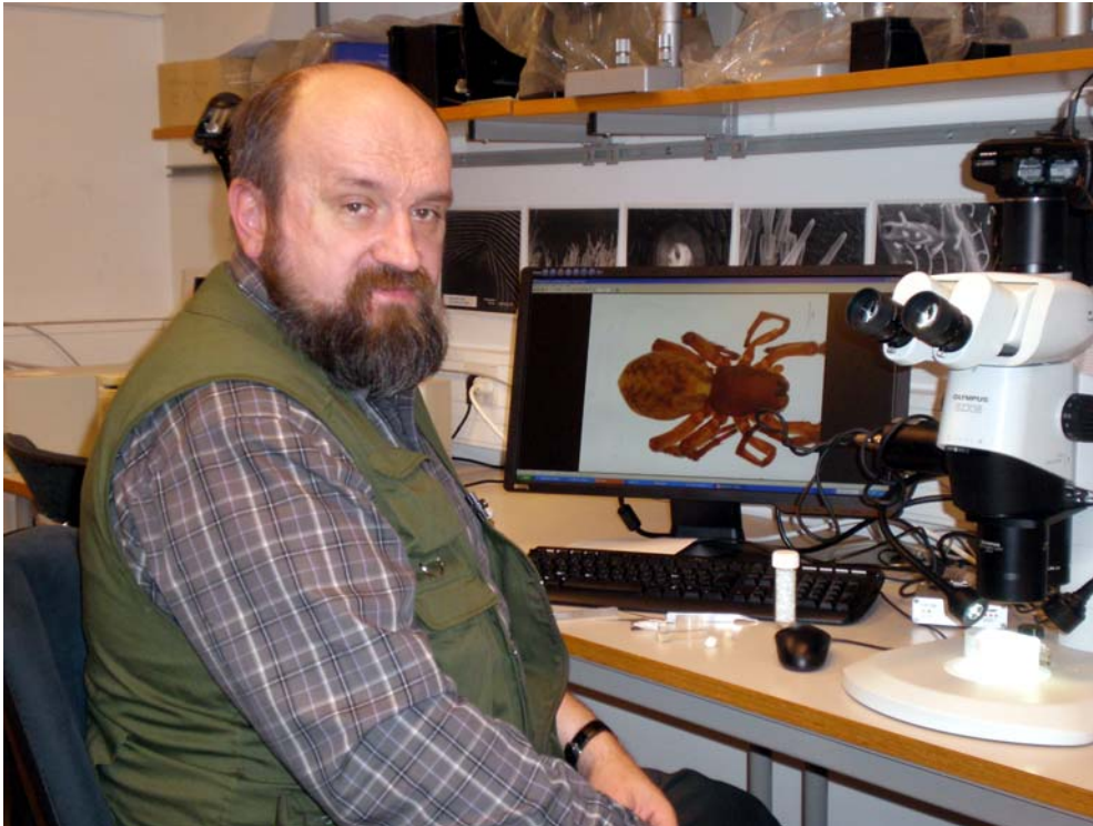
За работой в Зоологическом музее университета в Турку, Финляндия.

своих исследованиях Ю.М. всегда пользуется самыми современными подходами и методами. Он — один из первых российских арахнологов, кто освоил цифровую фотографию, и теперь почти все его работы иллюстрированы фотографиями.