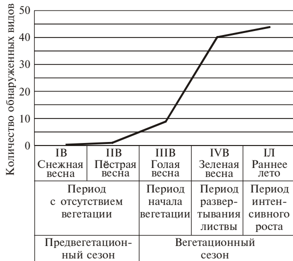
Рис. 2. Изменение количества видов пилильщиков в различные фазы весеннего сезона.

Fig. 2. Sawflies species number alteration during different phases of spring season.