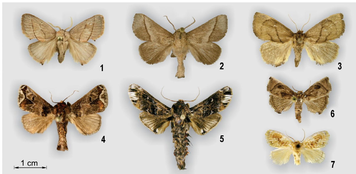
Рис. 1–7. Внешний вид самцов. 1 — Rhamnosa angulata (Россия, Приморский край, город Камень-Рыболов, в помещении под лампой, 2.VII.2014, О.Э. Костерин; SZMN); 2 — Thosea sinensis (Korea, Prov. Kangwon, Mt. Kumgang-san, Hotel Kumgang-san, 25.VII.1982, leg. Dr. L. Forró, Dr. L. Ronkay; MWM); 3 — Ceratonema butleri (Japan, Otsuki Yamanashi, Koganesawarindo Fukushima, 2.VI.1990, leg. Y. Kishida; MWM); 4 — Phlossa conjuncta (Vietnam, Yen-Bai, An-chy, 21°42' N, 104°18' E, primary forest, V.1996; MWM); 5 — Belippa horrida (Thailand, Changwat Nan, 30 km E Pua, 1700 m, 10–11.VIII.1999, leg. T. Csövári, L. Mikus; MWM); 6 — Ceratonema imitatrix (China, Wuyishan, Jiangxi — Fujian border, 50 km SE of Yingtan, 27°56' N, 117°25' E, 1600 m, V.2002, leg. Siniaev & local coll.; MWM); 7 — Quasinarosa fulgens (Thailand, Changwat Phayao, 15 km SE of Chiang Muan, 640 m, 12.VIII.1999, leg. T. Csövári, L. Mikus; MWM).

Диагноз. Длина переднего крыла самцов 9–12 мм, самок — около 13 мм. Антенны самцов с двойной гребёной, вплоть до апекса. Антенны самок нитевидные, как и у прочих слизневидок. Основной цвет тела жёлто-охристый. Вид хорошо отличается от остальных слизневидок России по внешним признакам (рис. 1), а именно по форме и рисунку передних крыльев. Эти крылья с характерной парой (антемедиальной и постмедиальной) параллельных тёмно-коричневых тонких полос, идущих от нижнего края крыла к костальному. Половой диморфизм в крыловом рисунке отсутствует. Передние крылья имеют хорошо заметную вырезку нижнего края у торнуса, за постмедиальной полосой.