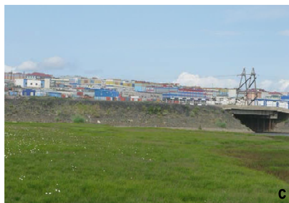
Рис. 1. Место сбора мух-журчалок: а, б — берег р. Анадырь, пункты 1, 2; с — окрестности г. Анадырь, пункт 3.

Fig. 1. Collecting place of hover flies: a, b — on the bank of Anadyr river, stations 1 and 2; c — in environs of the Anadyr town, station 3.