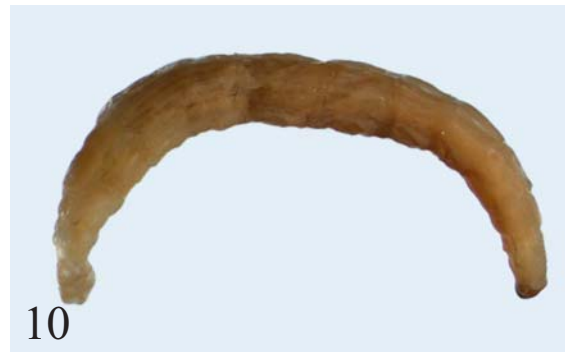
Рис. 10. Личинка Neoempheria sp. ( striata ?), общий вид (Азербайджан, Аврора, № 169, в грибе, М.Л. Данилевский).

Род Neoempheria Osten-Sacken, 1863 на территории России представлен 7 видами [Зайцев, 1994]. Имаго встречаются в лесах умеренной зоны, относятся к редким видам насекомых. Личинки обитают на поверхности пленок мицелия или резупинатных тел ксилотрофных грибов на разлагающейся древесине. Образ жизни сходен с таковым личинок Mycomya . Личинки встречаются как на поверхности древесины, так и на гименофорах трутовых грибов. Личинки передвигаются по слизистым тягам секрета слюнных желез. Куколка свободная с сильно склеротизованными покровами (Рис. 11). Тип питания личинок, очевидно, такой же, как у представителей рода Mycomya —