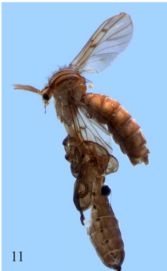
Рис. 11. Имаго Neoempheria sp., выходящее из куколки. Fig. 11. Imago of Neoempheria sp., emerging from pupa.

Предварительное изучение личинок различных подсемейств Mycetophilidae , хранящихся в коллекции Института проблем экологии и эволюции (ИПЭЭ РАН, Москва) показало, что основным первичным признаком для определения подсемейств можно считать только строение головной капсулы с вентральной стороны. У представителей Mycetophilidae встречаются следующие типы головной капсулы: незамкнутая головная капсула (в этом случае вентральные пластинки головы широко расставлены и не соприкасаются) и различные варианты замкнутой голов-