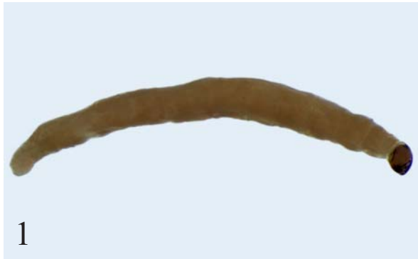
Рис. 1. Личинка Mycomya sp., общий вид (Россия, Хабаровский край, Бычиха, № 293, под корой осины, А.И. Зайцев).

Fig. 1. Larva of Mycomya sp., general view (Russia, Khabarovskiy Kray, Bychikha, No. 293, under the bark of Populus , A.I. Zaitzev).