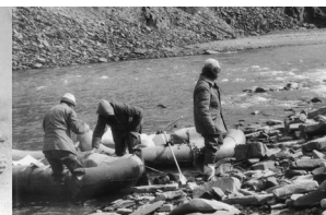
Дорогами Севера: Агапа, 1973; Хатанга, 1971 (П. Перов); окр. Инты, 1978; Берис (приток Лены), 1989.